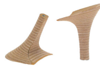
TACCO FASCIATO CUIOIO SPILLO - H 95

R.201-52.C014 TACCO FASCIATO CUIOIO - MM 60 CONFORT