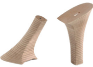
TACCO FASCIATO CUIOIO QUEEN - H 120

R.201-52.C006 TACCO FASCIATO CUIOIO - MM 115 TOWER