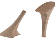
TACCO FASCIATO CUIOIO CONFORT - H 130

R.201-52.C004 TACCO FASCIATO CUIOIO - MM 120 QUEEN