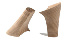
TACCO FASCIATO CUIOIO ORO - H 80

R.201-52.013 TACCO FASCIATO CUIOIO - MM 12 NEW 773