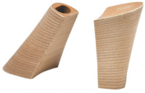
TACCO FASCIATO CUIOIO TOWER - H 115

R.201-52.C015 TACCO FASCIATO CUIOIO - MM 110 CONFORT