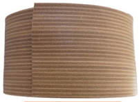
FASCIA CUIOIO ALTEZZA 10 CM

RIPARAZIONE E ORTOPEDIA / COMPONENTI / TACCHI FASCIATI CUIOIO