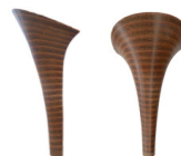
TACCO FASCIATO CUIOIO FRODO - H 100

R.201-52.C009 TACCO FASCIATO CUIOIO - MM 70 CONFORT