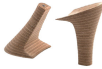
TACCO FASCIATO CUIOIO QUEEN - H 70

R.201-52.040B FASCIA CUIOIO PER TACCHI AL METRO H.100