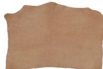
SPALLA VEGETALE ORTHO 02 - NATURALE

R.000-02.007 GROPPONE VEGETALE CASTAGNO NC07 NATURALE - MM 3.8/4.1