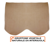
GROPPONE VEGETALE NATURALE DA INTERSUOLA

R.000-07.002 SPALLA VEGETALE ORTHO 02 NATURALE - DA 0,6 A 3,2 MM