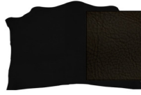
SPALLA VEGETALE MX12A COLORATA VOLONATA

R.000-03.507 DORSALE VEGETALE MIMOSA NC07 COLORATO - MM 5/5,5