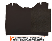
GROPPONE VEGETALE MX06 COLORATO VOLONATO

R.000-07.003 SPALLA VEGETALE ORTHO 03 LUCIDA - DA 0,6 A 3,2 MM