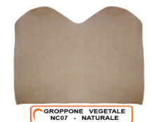
GROPPONE VEGETALE NC07 - NATURALE

R.000-07.001 SPALLA VEGETALE ORTHO 01 SEMIGRASSA - DA 0,6 A 3,2 MM