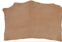
SPALLA VEGETALE ORTHO 01 - SEMIGRASSA

R.000-04.001 FIANCO VEGETALE NATURALE - MM 1,8/2