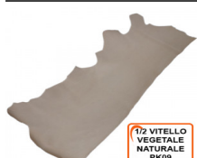
1/2 VITELLO VEGETALE NATURALE PK09

R.000-05.008 SPALLA VEGETALE QUEBRACHO NZ08 NATURALE MM DA 1.8 A 2.8