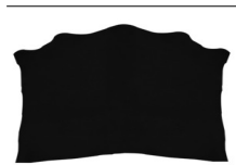
SPALLA VEGETALE MX12 COLORATA

R.000-06.003 SPALLA VEGETALE VACCHETTA TOP - MM DA 1,8 A 3,0