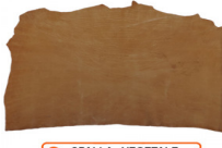
SPALLA VEGETALE ORTHO 03 - LUCIDA

R.000-02.008 GROPPONE VEGETALE CASTAGNO NC08 NATURALE DA INTERSUOLA - MM 4.5/5.5