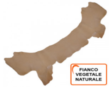
FIANCO VEGETALE NATURALE

R.000-03.012A SPALLA VEGETALE MIMOSA MX12A COLORATA VOLONATA - MM 3/3,5