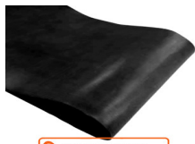
DORSALE MM 5/5,5

RIPARAZIONE E ORTOPEDIA / PELLAMI / PELLE AL VEGETALE