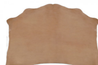
SPALLA VEGETALE NZ08 NATURALE

R.000-03.506 GROPPONE VEGETALE MIMOSA MX06 COLORATO BASIC - MM 3/3,5