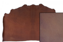
SPALLA VEGETALE VACCHETTA TOP

R.000-02.005 SPALLA VEGETALE CASTAGNO NC05 NATURALE - MM 3/3,2