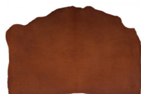
SPALLA VEGETALE VACCHETTA ECONOMY

R.000-05.009 MEZZI VITELLI VEGETALE QUEBRACHO PK09 NATURALE - MM 1,2