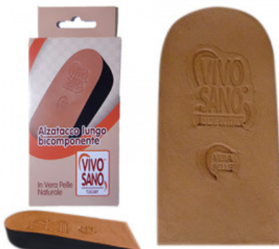
ALZATACCO BICOMPONENTE RIGIDO VERA PELLE mm 30

S.012-01.001 TALLONETTA PIATTA IN GEL CON ANTISHOCK