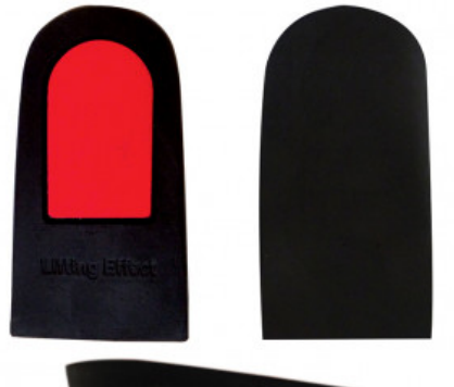
ALZATACCO RIGIDO GREZZO BICOMPONENTE mm 10