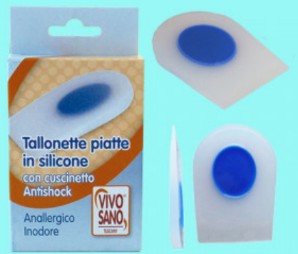
TALLONETTA PIATTA IN SILICONE CON ANTISHOCK

S.008-00.102 ALZATACCO RIGIDO BICOMPONENTE VERA PELLE MM 25