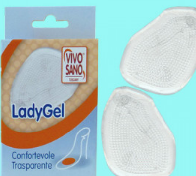
ANTIGLISS LADY GEL

S.001-06.000 ALZATACCO CONFORTEVOLE GREZZO