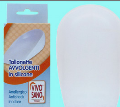
AVVOLGENTE IN GEL

S.001-06.104 ALZATACCO RIGIDO BICOMPONENTE GREZZO MM 10