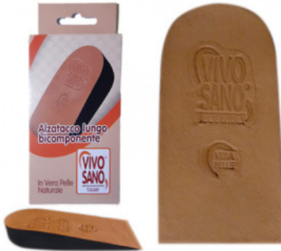
ALZATACCO BICOMPONENTE RIGIDO VERA PELLE mm 25