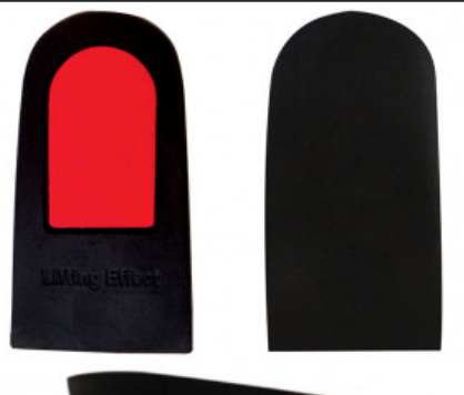
ALZATACCO RIGIDO GREZZO BICOMPONENTE mm 15

S.012-01.002 TALLONETTA AVVOLGENTE IN GEL