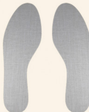
SOLETTA SUGHERO DOPPIA TELA

S.002-01.001 SALVACALZE CAMOSCIO ADESIVO UOMO COL. CHIARO REFLEX