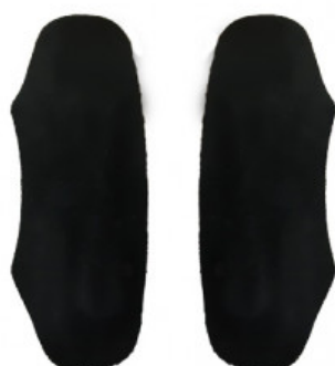
SALVACALZE UOMO CAMOSCIO NERO

S.001-03.000 SOLETTA IN SUGHERO CON DOPPIA TELA CONF. DA 12 PAIA