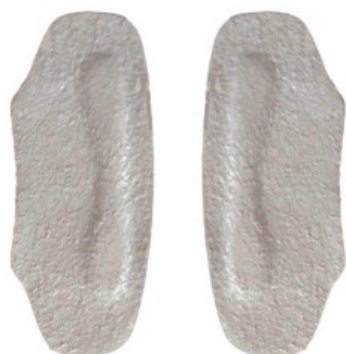
SALVACALZE UOMO CAMOSCIO GRIGIO