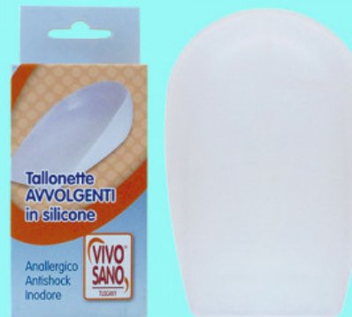
AVVOLGENTE IN GEL

S.001-06.104 ALZATACCO RIGIDO BICOMPONENTE GREZZO MM 10