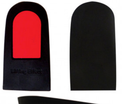
ALZATACCO RIGIDO GREZZO BICOMPONENTE mm 15

S.012-01.002 TALLONETTA AVVOLGENTE IN GEL