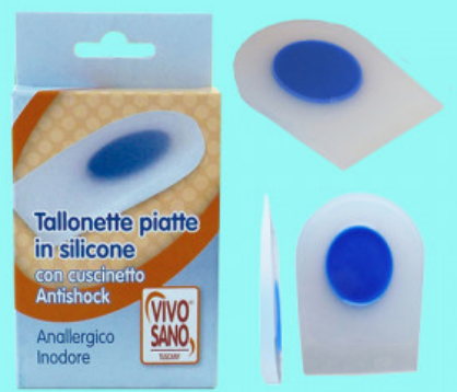
TALLONETTA PIATTA IN SILICONE CON ANTISHOCK

S.008-00.102 ALZATACCO RIGIDO BICOMPONENTE VERA PELLE MM 25