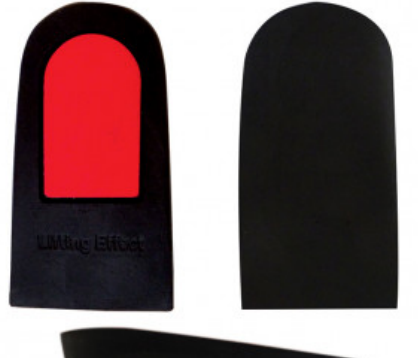
ALZATACCO RIGIDO GREZZO BICOMPONENTE mm 10