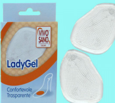
ANTIGLISS LADY GEL

S.001-06.000 ALZATACCO CONFORTEVOLE GREZZO