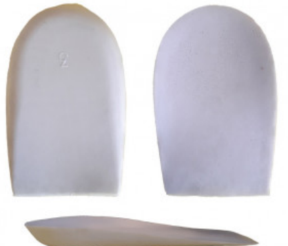
ALZATACCO GREZZO CONFORTEVOLE

S.008-00.103 ALZATACCO RIGIDO BICOMPONENTE VERA PELLE MM 30