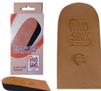
ALZATACCO BICOMPONENTE RIGIDO VERA PELLE mm 30

S.012-01.001 TALLONETTA PIATTA IN GEL CON ANTISHOCK