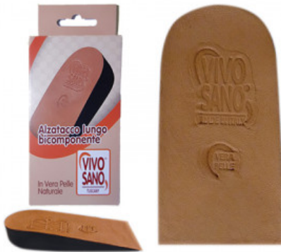
ALZATACCO BICOMPONENTE RIGIDO VERA PELLE mm 25