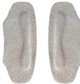
SALVACALZE UOMO CAMOSCIO GRIGIO

S.001-06.102 ALZATACCO RIGIDO BICOMPONENTE GREZZO MM 25