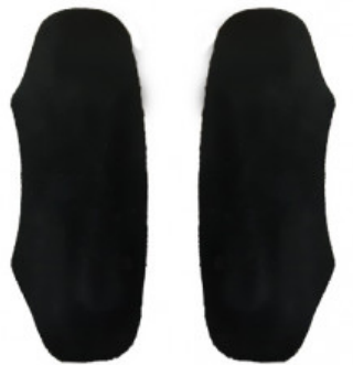
SALVACALZE UOMO CAMOSCIO NERO

S.001-06.103 ALZATACCO RIGIDO BICOMPONENTE GREZZO MM 30