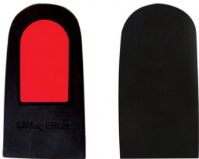
ALZATACCO RIGIDO GREZZO BICOMPONENTE mm 30

S.002-01.001 SALVACALZE CAMOSCIO ADESIVO UOMO COL. CHIARO REFLEX