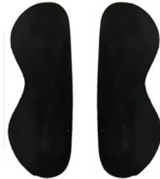
SALVACALZE DONNA CAMOSCIO NERO

S.001-06.101 ALZATACCO RIGIDO BICOMPONENTE GREZZO MM 20