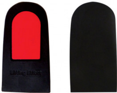
ALZATACCO RIGIDO GREZZO BICOMPONENTE mm 25

S.002-02.002 SALVACALZE CAMOSCIO ADESIVO DONNA COL. NERO REFLEX