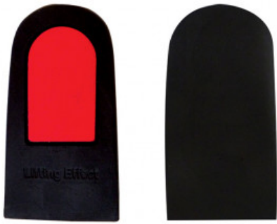
ALZATACCO RIGIDO GREZZO BICOMPONENTE mm 20