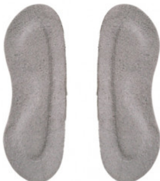
SALVACALZE DONNA CAMOSCIO GRIGIO

S.002-01.002 SALVACALZE CAMOSCIO ADESIVO UOMO COL. NERO REFLEX