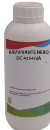
RAVVIVANTE NERO DC 4354/2A

RIPARAZIONE E ORTOPEDIA / CHIMICA / FENICE