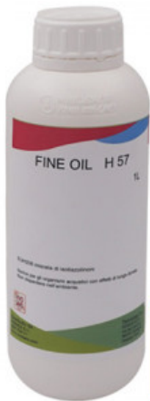
FINE OIL H 57

R.010-50.0100 KIT VERNICI PER RITOCO HP - FENICE