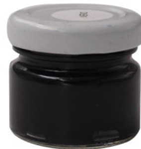
CREMA COPRENTE TEKNO

R.010-47.0112 FRINE GLASS PASTA - 200 ML REFLEX