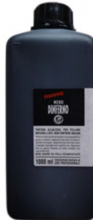
NERO D'INFERNO 1 LITRO

R.010-51.0150 PENNELLI SET DA 5 PZ - ANGELUS