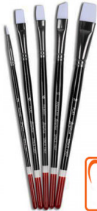
PENNELLI SET - 5 PZ

RIPARAZIONE E ORTOPEDIA / CHIMICA / ANGELUS