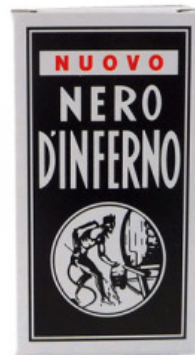
NERO D'INFERNO 50 ML

R.010-51.0151 SET PENNARELLI CON RICAMBIO PUNTA DA 3 MM - ANGELUS