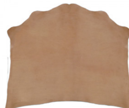
SPALLA VEGETALE NZ08 NATURALE

R.000-03.012A SPALLA VEGETALE MIMOSA MX12A COLORATA VOLONATA - MM 3/3,5