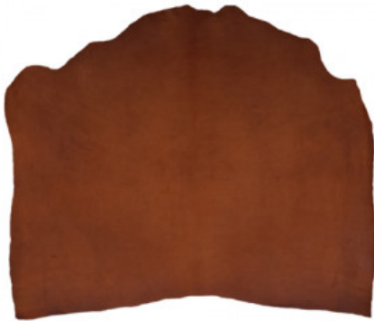
SPALLA VEGETALE VACCHETTA ECONOMY

RIPARAZIONE E ORTOPEDIA / PELLAMI / PELLE AL VEGETALE