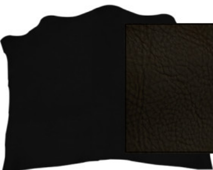
SPALLA VEGETALE MX12A COLORATA VOLONATA

R.000-07.003 SPALLA VEGETALE ORTHO 03 LUCIDA - DA 0,6 A 3,2 MM