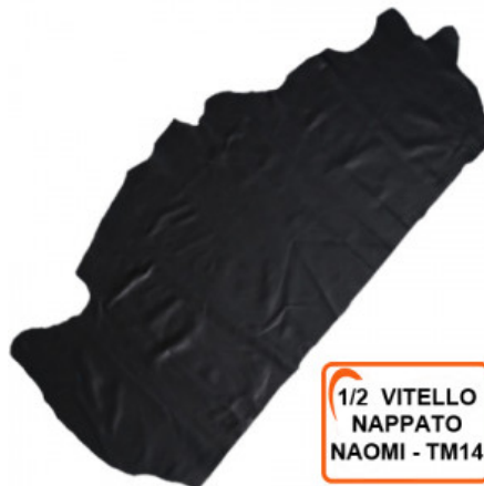
1/2 VITELLO NAPPATO NAOMI - TM14

R.000-09.012 PELLE MONTONE NAPPATO PER PELLETTERIA - MM 0,8/1