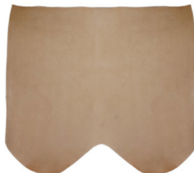
GROPPONE VEGETALE NATURALE DA INTERSUOLA

R.000-01.301 SPALLE CUIO TOP - MM 2,2/2,5