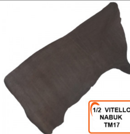
1/2 VITELLO NABUK TM17

R.000-09.013 PELLE CAMOSCIO PER TOMAIE CARDETO 13 - MM 1,1-1,2