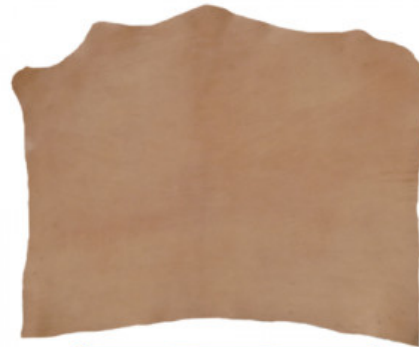
SPALLA VEGETALE ORTHO 01 - SEMIGRASSA

R.000-05.009 MEZZI VITELLI VEGETALE QUEBRACHO PK09 NATURALE - MM 1,2