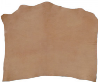
SPALLA VEGETALE NZ05 NATURALE

R.000-07.001 SPALLA VEGETALE ORTHO 01 SEMIGRASSA - DA 0,6 A 3,2 MM