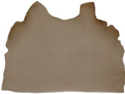
SPALLA CUIO GREZZA MM 1,8/2 - 2,2/2,5

RIPARAZIONE E ORTOPEDIA / PELLAMI / GROPPONI E SPALLE A CUIO