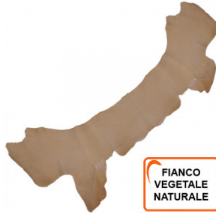
FIANCO VEGETALE NATURALE

R.000-01.302 SPALLA CUIO GREZZA - MM DA 1,8/2 A 2,2/2,5