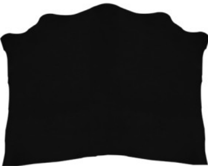
SPALLA VEGETALE MX12 COLORATA

R.000-07.002 SPALLA VEGETALE ORTHO 02 NATURALE - DA 0,6 A 3,2 MM