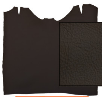
GROPPONE VEGETALE MX06 COLORATO VOLONATO

R.000-03.507 DORSALE VEGETALE MIMOSA NC07 COLORATO - MM 5/5.5