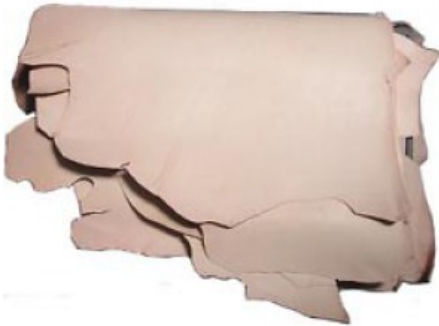
GROPPONE VEGETALE NC07 - NATURALE

R.000-04.001 FIANCO VEGETALE NATURALE - MM 1,8/2