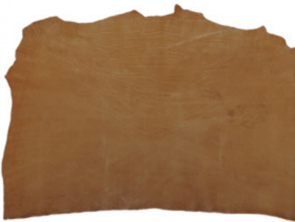
SPALLA VEGETALE ORTHO 03 - LUCIDA

R.000-03.012 SPALLA VEGETALE MIMOSA MX12 COLORATA - MM 3/3,5