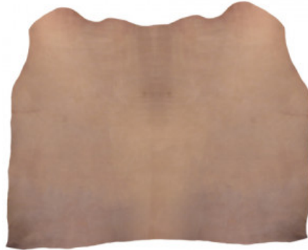
SPALLA CUIO TOP

R.000-02.007 GROPPONE VEGETALE CASTAGNO NC07 NATURALE - MM 3.8/4.1