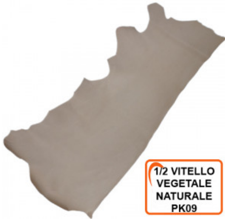
1/2 VITELLO VEGETALE NATURALE PK09

RIPARAZIONE E ORTOPEDIA / PELLAMI / PELLE AL VEGETALE