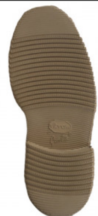
SUOLA 2600 LIVERPOOL 35/6 - 37/8 - 39/0 BEIGE

GV.006-01.0007 SUOLA LIVERPOOL 2600 MIS. 47/49