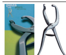
R.012-01.006 PINZA PER CALLI CALZATURE TEKNO