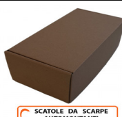
R.012-05.005 SCATOLA DA SCARPE AUTOMONTANTE