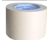
R.012-05.004 NASTRO CARTA PER MODELLI H. 100