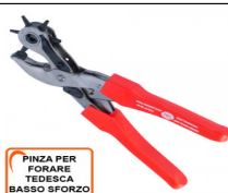
R.012-01.007 PINZA PER FORARE REVOLVER TEDESCA - BASSO SFORZO