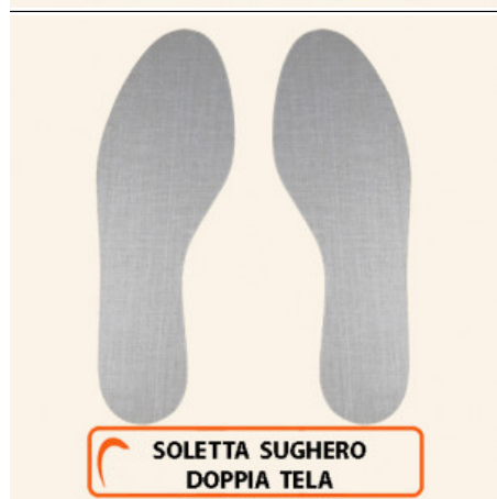
SOLETTA SUGHERO DOPPIA TELA