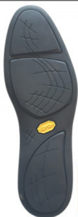
SUOLA PELICAN 2141

GV.006-06.0001 SUOLA SHELL 887K MIS. DA 35 A 41