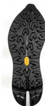
SUOLA SPHIKE 186C

GV.006-39.0001 SUOLA SCATTER 0546C MIS. DA 38 A 44