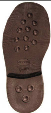
SUOLA AVANA 2659 37/8 - 39/0 - 41/2

GV.006-31.0001 SUOLA BETULLA 4303 MIS. 35/38