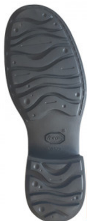
SUOLA ONDA 9123

GOMMA / VIBRAM / SUOLA CITTA' E ORTOPEDIA