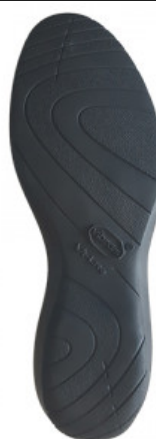
SUOLA SOFIA 9116

GV.006-34.0001 SUOLA ROCCIA NEWFLEX 528K