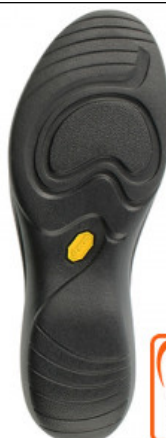
SUOLA SHELL 887K

GV.006-40.0001 SUOLA ONDA 9123 MIS. DA 36 AL 41