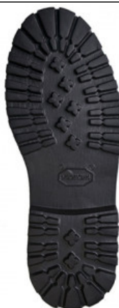
SUOLA BETULLA 4303 mis. 42/44

GV.006-35.0002 SUOLA AVANA 2659 MIS. 43/44 - 45/46