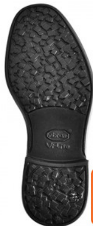
SUOLA SCATTER 0546C

GV.006-38.0001 SUOLA SOFIA 9116 MIS. DA 36 A 41