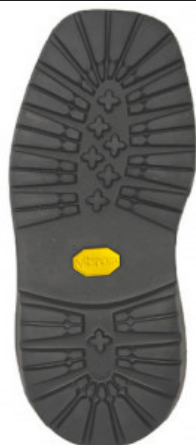
SUOLA ROCCIA NEWFLEX 528K

GOMMA / VIBRAM / SUOLA CITTA' E ORTOPEDIA