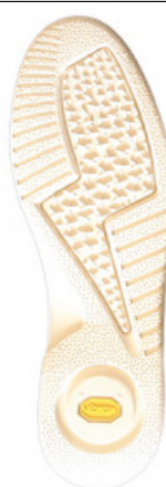
SUOLA SLANG 2548

GV.006-09.0001 SUOLA PELICAN 2141 MIS. DA 40 AL 45