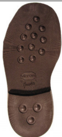
SUOLA AVANA 2659 43/4 - 45/6

GV.006-31.0002 SUOLA BETULLA 4303 MIS. 39/41