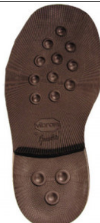
SUOLA AVANA 2659 47/9 - 50/2

GV.006-41.0004 SUOLA 90'S RUNNER 879C DAL 3 AL 13