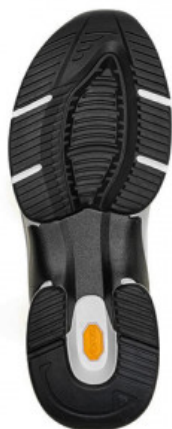
SUOLA 90'S RUNNER 879C

GOMMA / VIBRAM / SUOLA CITTA' E ORTOPEDIA