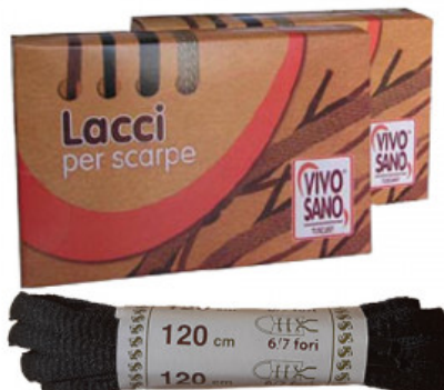
OVALE - CM 120

A.020-01.003 LACCIO CUIO QUADRATO CM 130