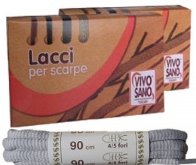
OVALE - CM 90

A.020-01.001 LACCIO CUIO QUADRATO CM 110