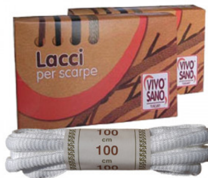
OVALE - CM 100

A.020-01.002 LACCIO CUIO QUADRATO CM 120