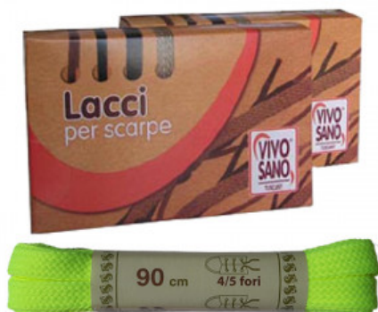
PIATTO FLUO - CM 90