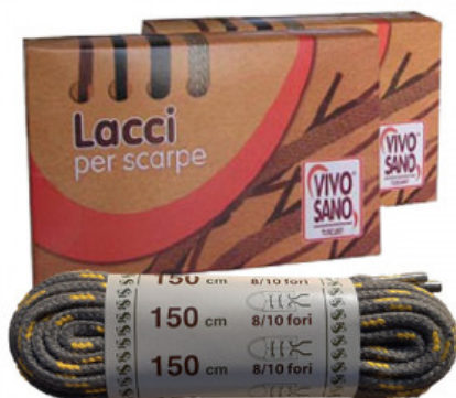
TREKKING - CM 150