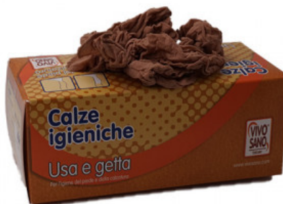
CALZE IGIENICHE GAMBALETTA - ECONOMY

A.014-01.120 LACCIO PIATTO MEDIO FLUO CM 120