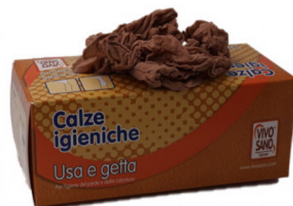
CALZE IGIENICHE ECONOMY

ACCESSORI / ACCESSORI VIVO SANO / CALZE IGIENICHE