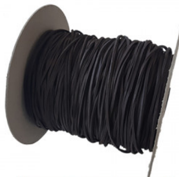
LACCIO CUOIO - AL METRO

A.013-01.150 LACCIO COTONE TONDO TREKKING CM 150