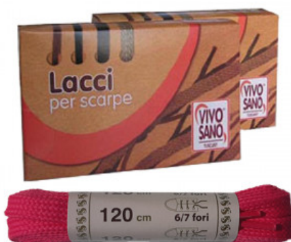
PIATTO FLUO - CM 120

A.008-10.002A CALZE USA E GETTA SACCHETTO RICARICA 144 PZ ECONOMY