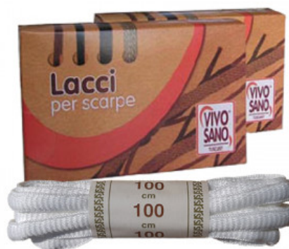
OVALE - CM 100

A.020-01.002 LACCIO CUOIO QUADRATO CM 120