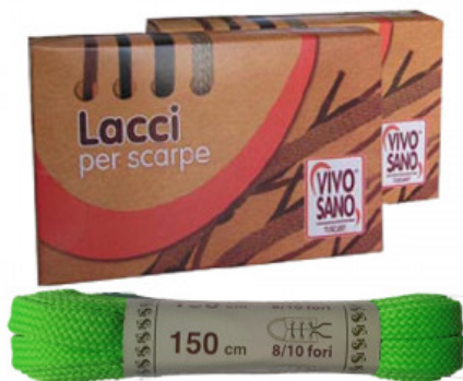
PIATTO FLUO - CM 150

A.008-10.003 GAMBALETTI USA E GETTA 72 PZ ECONOMY