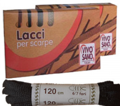
OVALE - CM 120

A.020-01.003 LACCIO CUOIO QUADRATO CM 130