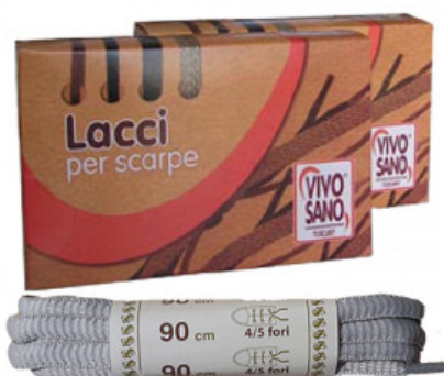
OVALE - CM 90

A.020-01.001 LACCIO CUOIO QUADRATO CM 110